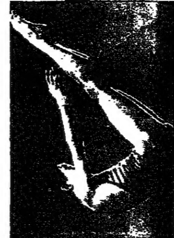
لطفة من مباراة البرازيل والاتحاد السوفياتي لكرة السلة

تتبع تاليف بطولات الصين في مسابقات الفطس في دورة ألعاب التوايا الحسنة الثانية في سيال. وبعد فوز غاو من بذهبية السلة المنزوح من ارتفاعي متر واحد وثلاثة امتار فازت فو مينغ شيا 11/11 عاما بذهبية السلة الثانية من ارتفاع 10 امتار.